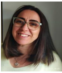
PRESIDENTA: NACHA CORREA MOLINO